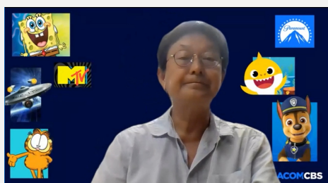
井股氏によるセミナーの様子